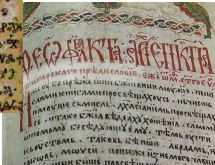
Le cyrillique créé le plus probablement par leurs disciples

Горда Стара планина, до ней Дунава синей, слънце Тракия огрява, над Пирина пламеней.