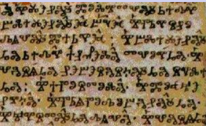
L'alphabet glagolitique de Cyrille et Méthode